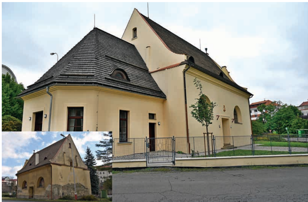
Kostelík před rekonstrukcí a v nové podobě.

V roce 1923 koupila budovu bývalé „solárny“ Českobratrská církev evangelická, aby zde opět zřídila modlitebnu. Ta byla slavnostně otevřena 29. května 1924. Od 2. světové války kostelík postupně chátral, v sedmdesátých letech byla fasáda opravena s věpomocí, ale nasolené zdivo se po několika letech opět začalo ukazovat. Proto se začala připravovat rozsáhlá rekonstrukce kostela. V roce 2010 byla provedena celková oprava krovu a šindelové střešní krytiny. Následovaly přípravné práce k sanaci vlhkého zdiva. Přístavba byla dokončena