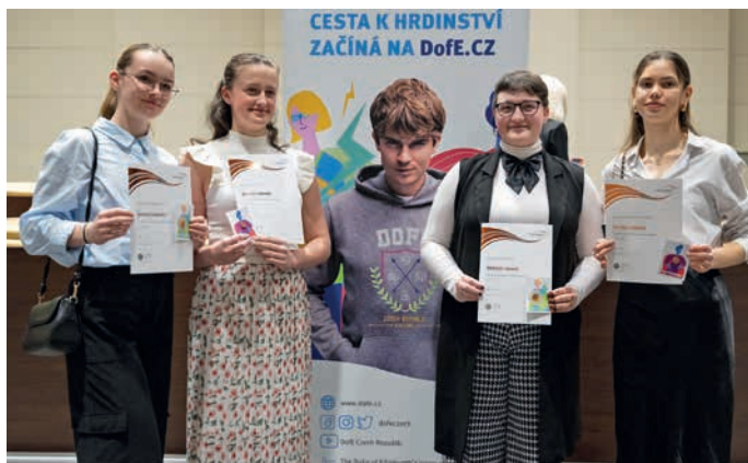
Prestížní ocenění DofE získali i studenti a studentky z Hranic.

V České republice program inspiruje mladé lidi ve věku od 14 do 24 let již od roku 1995 a v roce 2023 se do něj zapojilo nově 5 300 studentů. V Olomouckém kraji v letošním roce plní program téměř stovka stu-