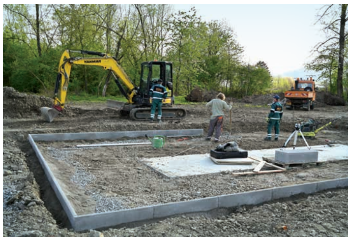
Výstavba horolezecké stěny poblíž nového skateparku začala v dubnu.

Návrhy se podávají na předepsaném formuláři, a to od 1. června do 30. září. V říjnu proběhne kontrola formální správnosti, případně doplnění návrhů, a v listopadu pak internetové hlasování. Realizace návrhů bývá závislá na jejich náročnosti, případně návaznosti na další investice. Proto byla napří-