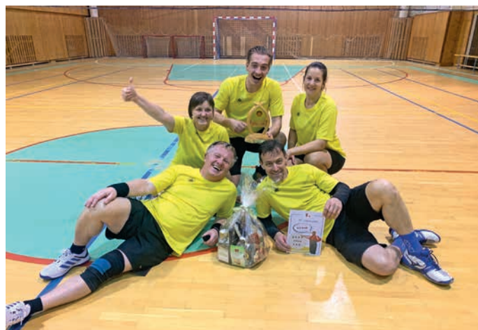
Vítězný tým ZŠ Struhlovsko.