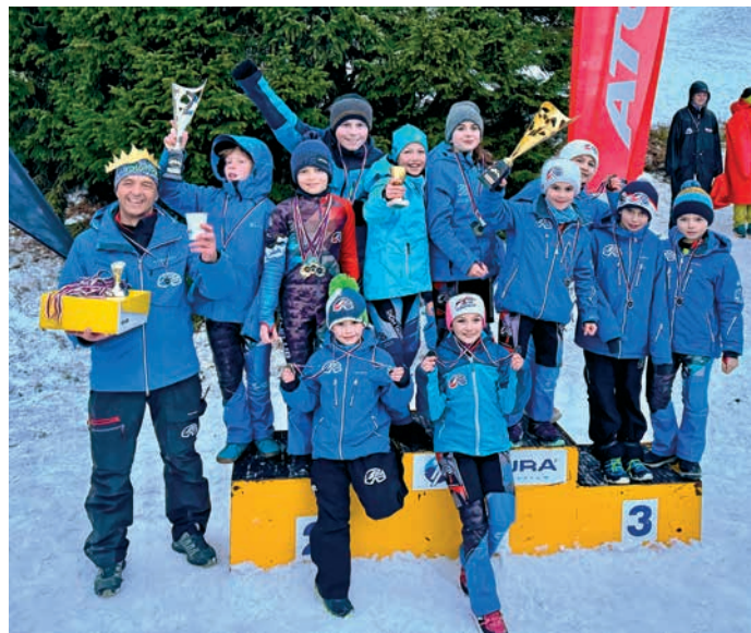
Madeja Cup a skvělé celkové druhé místo.

TIRÁŽ: Hranický zpravodaj č. 5/2024 - Periodický tisk územního samosprávného celku. - Vychází 12x ročně v Hranicích - Vychází 1. května 2024 - Ročník X. - Vydávající Městská kulturní zařízení Hranice, příspěvková organizace se sídlem Masarykovo náměstí 71, 753 01 Hranice, IČO: 71294686 - Grafická úprava a tisk: © KLEINWÄCHTER holding s.r.o., Čajkovského 1511, 738 01 Frýdek-Místek - Náklad: 8 600 ks - Distribuce: Česká pošta, zdarma do všech domácností v Hranicích a místních částí - Redakce: tel. 581 607 479, e-mail: infocentrum.zamek@mkz-hranice.cz - Editoři: Mgr. Petr Černocho, Ing. Petr Bakovský - Korektury: Mgr. Renata Doleželová - Hranický zpravodaj na internetu: www.mesto-hranice.cz/hranicky-zpravodaj - Zaregistrováno Ministerstvem kultury ČR pod zn. MK ČR E 22143 - Redakce si vyhrazuje právo příspěvků krátiť - Účastí na programech pořádaných Městskými kulturními zařízeními Hranice, p. o., IČO 71294686, dává jejich účastník souhlas s užitím pořízených fotografií a videodokumentace pro propagační materiály organizace (webové stránky, Hranický zpravodaj, tiskoviny, Facebook). Souhlas se dává do odvolání.